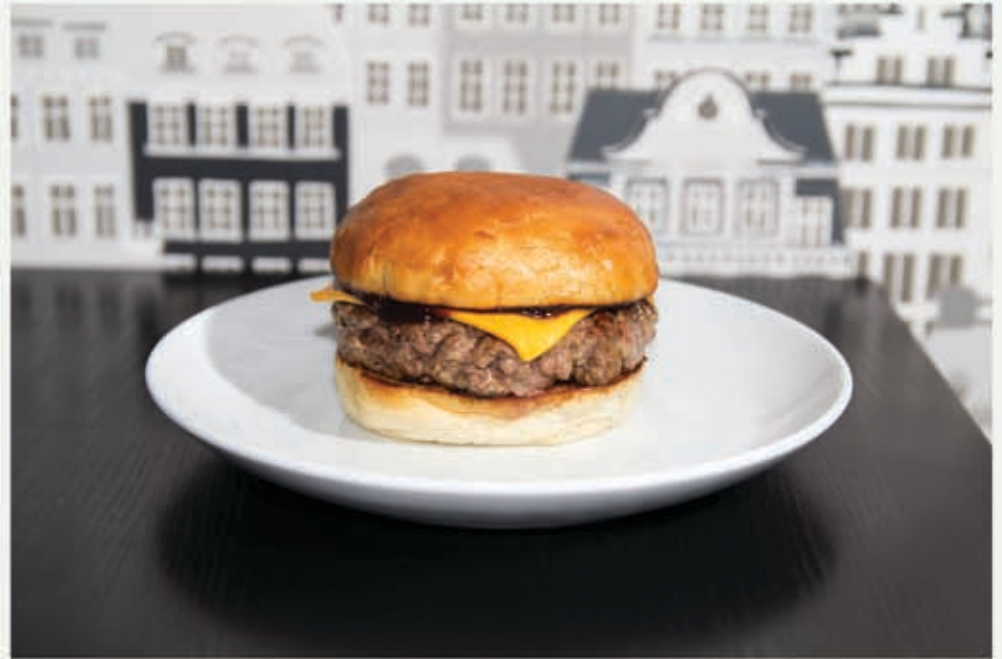
Yummy på Bun Meats Buns hamburgerevent på Flippin Burger

Nästa gång - Lektion 2 > Den mystiska stärkelsen